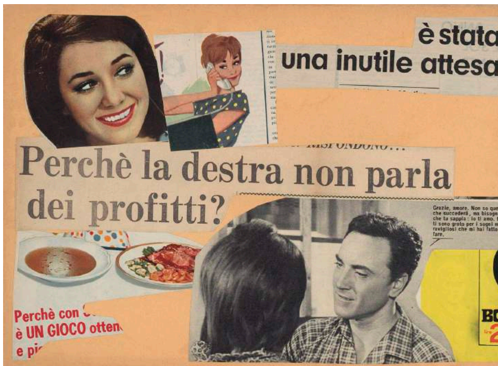
“E’ stata un inutile attesa” 1963