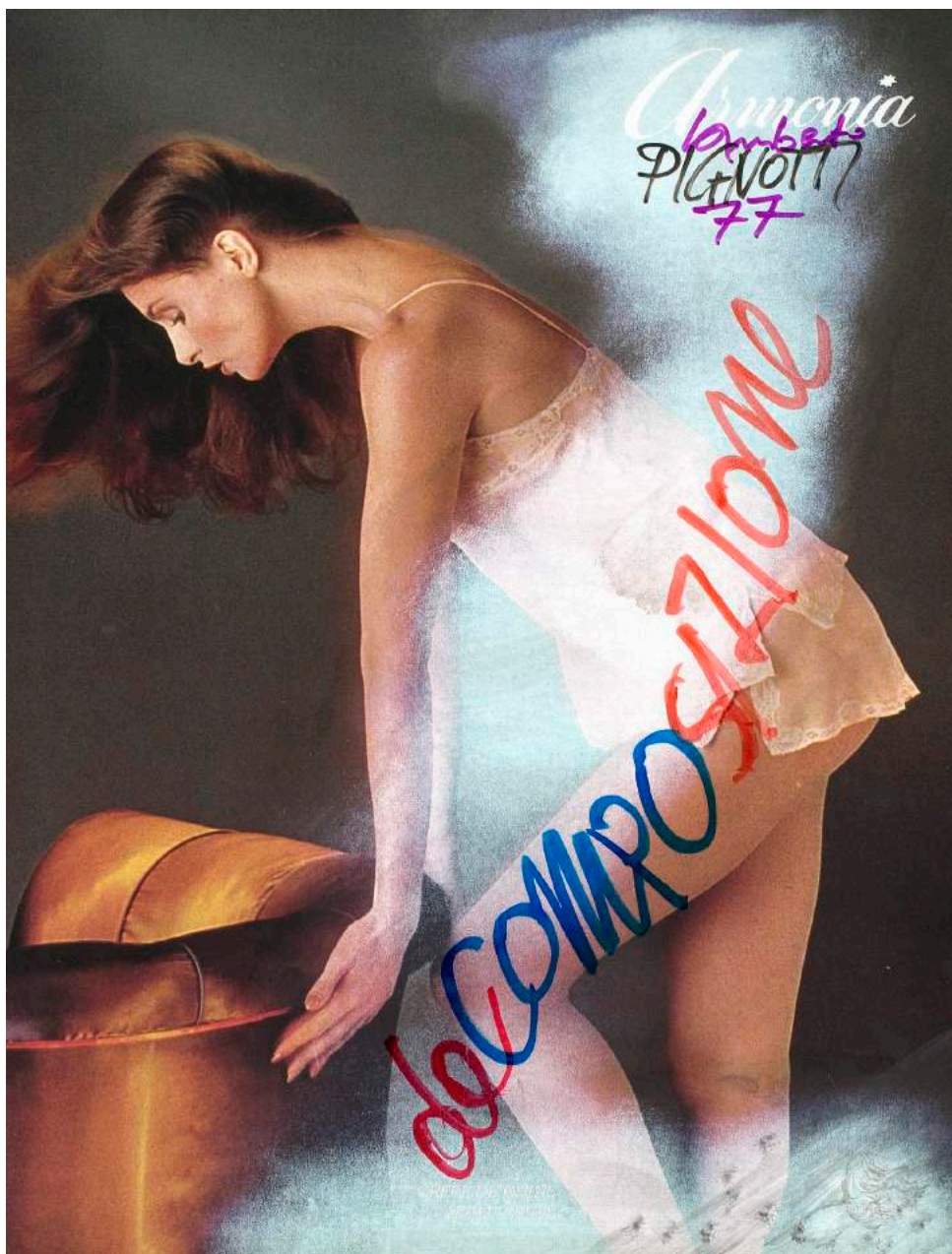
“Senza titolo” 1977

In questo caso la serie di de-composizione 1976 utilizza un'immagine di donna utilizzata dalla pubblicità. l'autore sceglie l'immagine di donna rappresentata secondo il classico stereotipo di donna oggetto desiderabile per destrutturarne il significato con l'intervento pittorico prima e grafico poi. nell'opera la donna cambia da materia commerciale a oggetto decomposto per dissacrare la presunta verità della reclam.