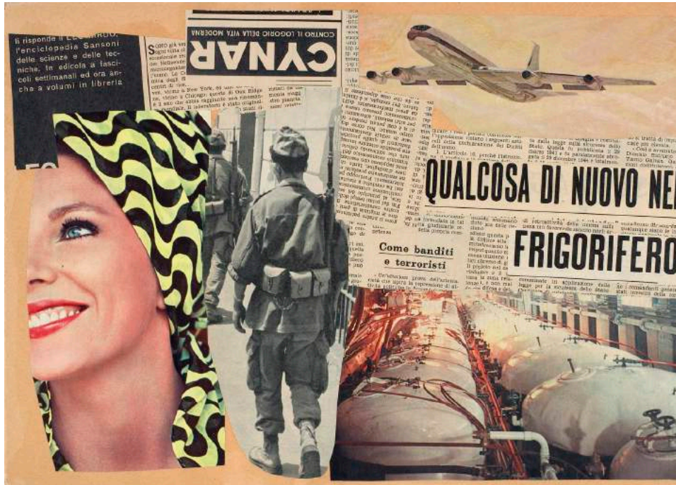
“Qualcosa di nuovo nel frigorifero” 1964