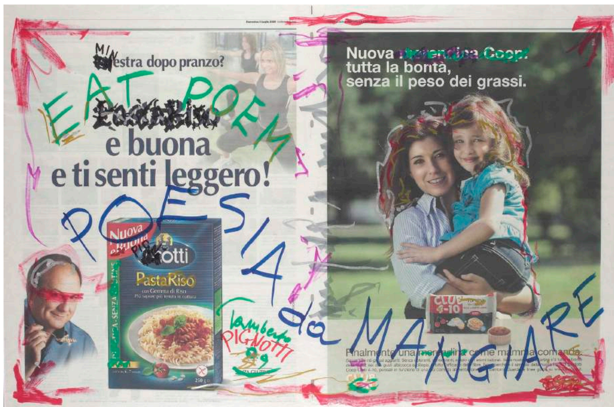
“Poesia da mangiare”2009

“Se è deprecabile usare la ‘rosa’ come se non fosse stato inventato il ‘frigorifero’ , è parimenti deprecabile usare il ‘frigorifero’ come se ‘la rosa’ fosse una specie vegetale estinta .”