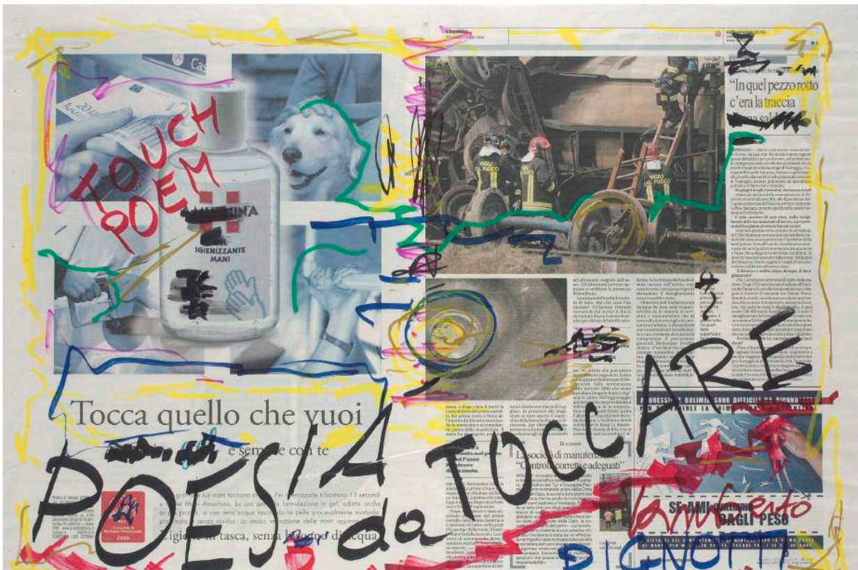
“Poesia da toccare”2009